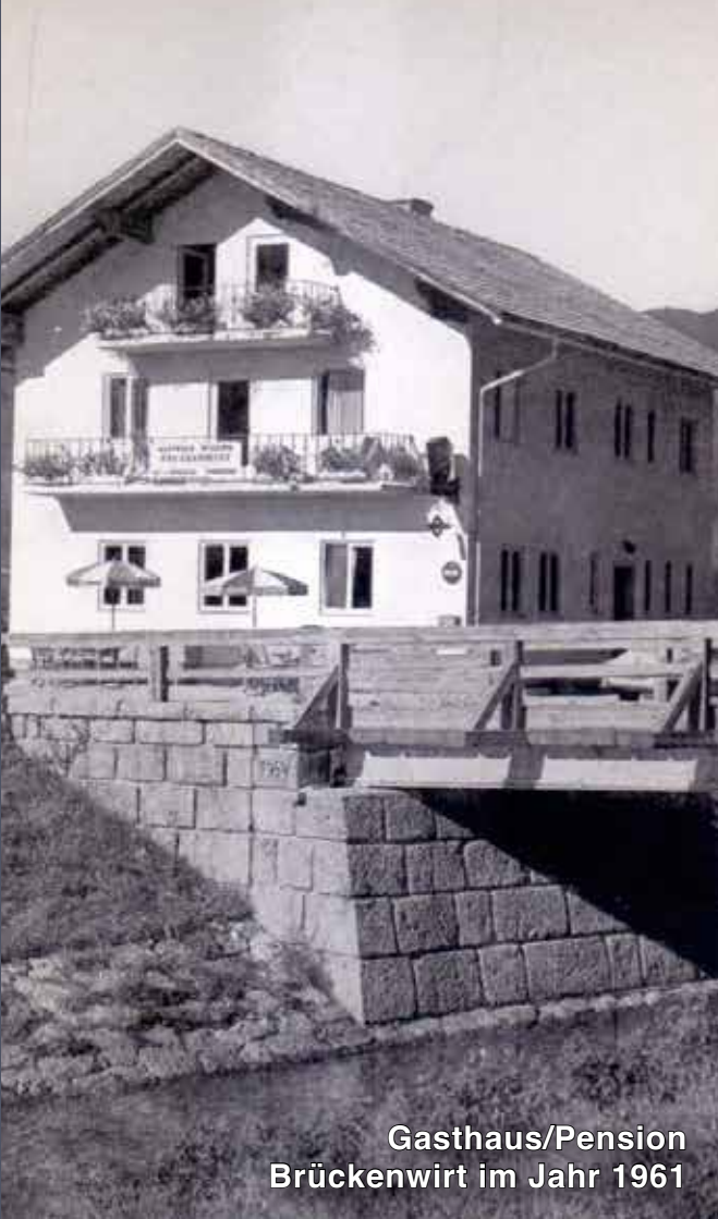
Gasthaus/Pension Brückenwirt im Jahr 1961