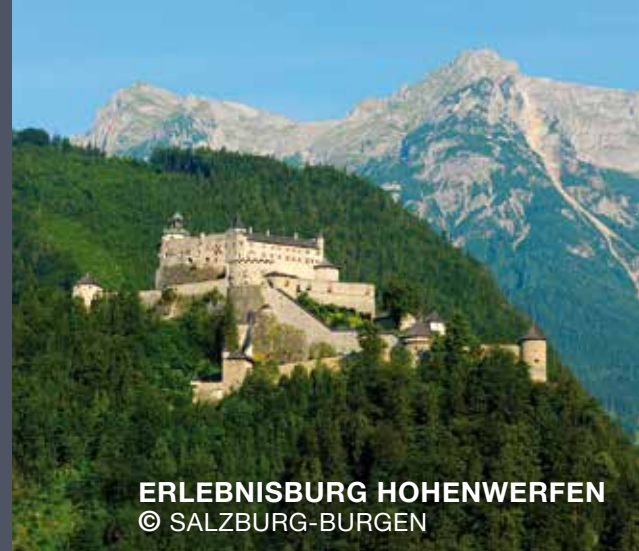
ERLEBNISBURG HOHENWERFEN

TIPP: Die Therme Amadé ist nur 10 Gehminuten vom Hotel entfernt. Die Therme Amadé ist eine Sole Therme für die ganze Familie mit 3 Rutschen, Springturm, Wellenbecken und einer Saunawelt für Erwachsene.