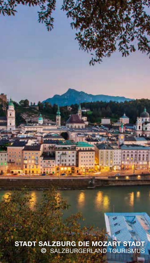
STADT SALZBURG DIE MOZART STADT